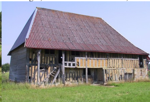
Quelques exemples d'architecture rurale