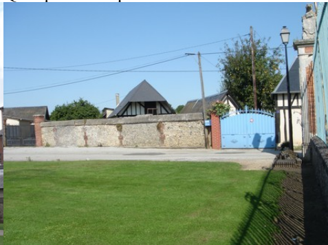
Le cadre bâti autour de la perspective