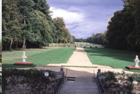
La perspective est (côté parc)