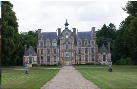
La façade ouest du château