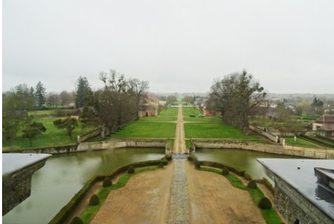
La perspective ouest (côté village)