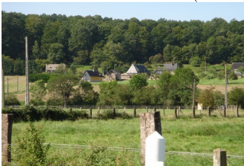
Les champs et les bois autour du village

Les avis seront cohérents avec ceux émis ces dernières années, à savoir : pas de maisons à volume compliqué (type V, W, Y, ou Z), Rez-de-chaussée + Combles, pentes à 45° pour les volumes principaux, ardoise ou tuile plate de teinte brun vieilli, à 20u/m 2 , avec un débord de toiture de 20cm, enduit de teinte beige clair avec modénatures (au choix : chaînages, encadrement de fenêtres, soubassement, colombage...). *Voir autres fiches.