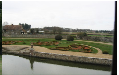
Les jardins avec parterres