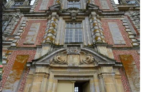
Le détail du fronton d'entrée

Pour la zone en rose foncé dans le périmètre de 500m