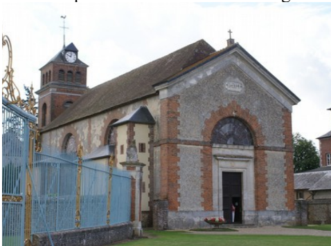
L'église de Beaumesnil