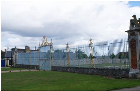
La grille d'entrée du château